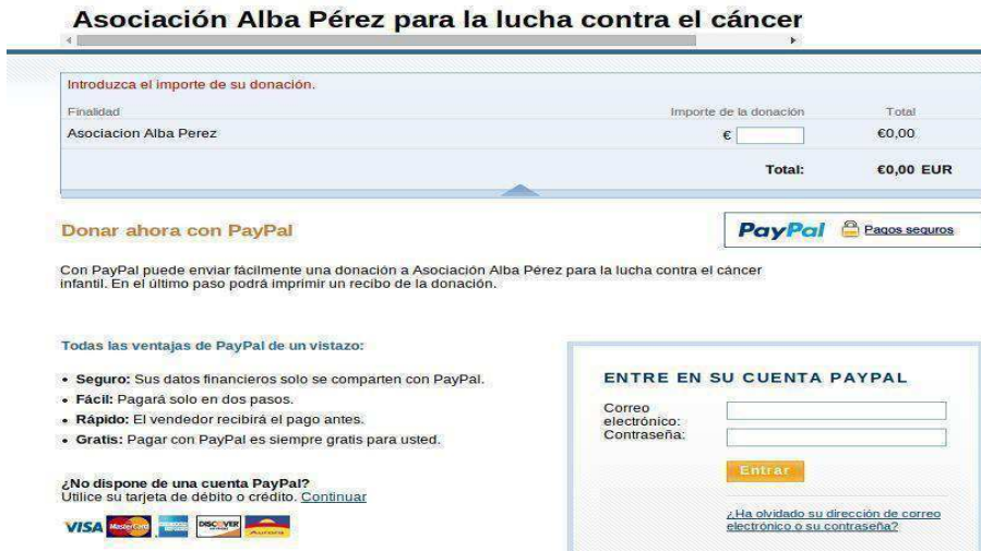
Figura. 6. Página web de Paypal para realizar donativos puntuales a la Asociación Alba Pérez.