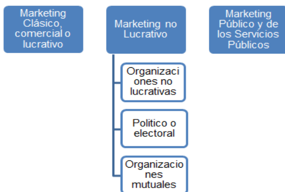
Figura. 1. Tipología de marketing en función del agente principal de intercambio.

En relación con las diferentes tipologías de marketing existentes, se diferencian diversos tipos (Vázquez, 2004). En primer lugar, tomando en cuenta el agente principal de intercambio, destacan tres tipos de marketing: