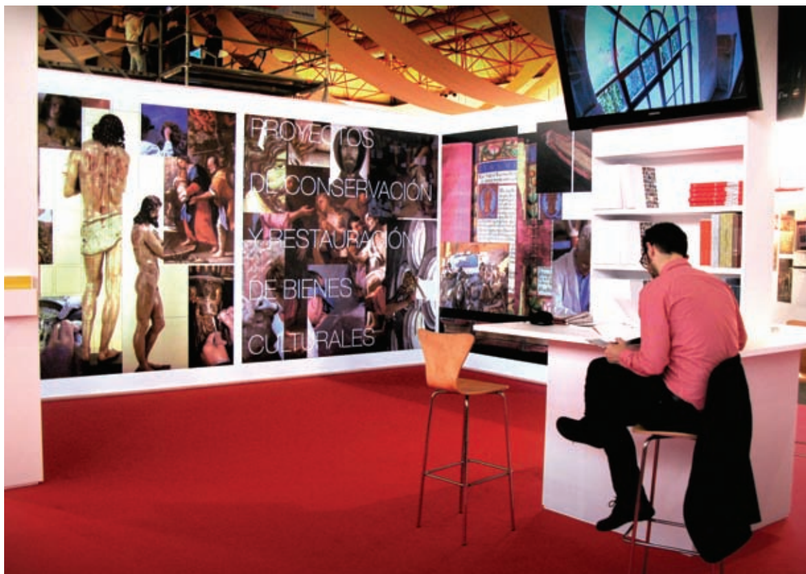
Arriba y abajo. Stand del Instituto del Patrimonio Cultural de España en la Feria Internacional de Restauración del Patrimonio. Granada. España, noviembre 2009.