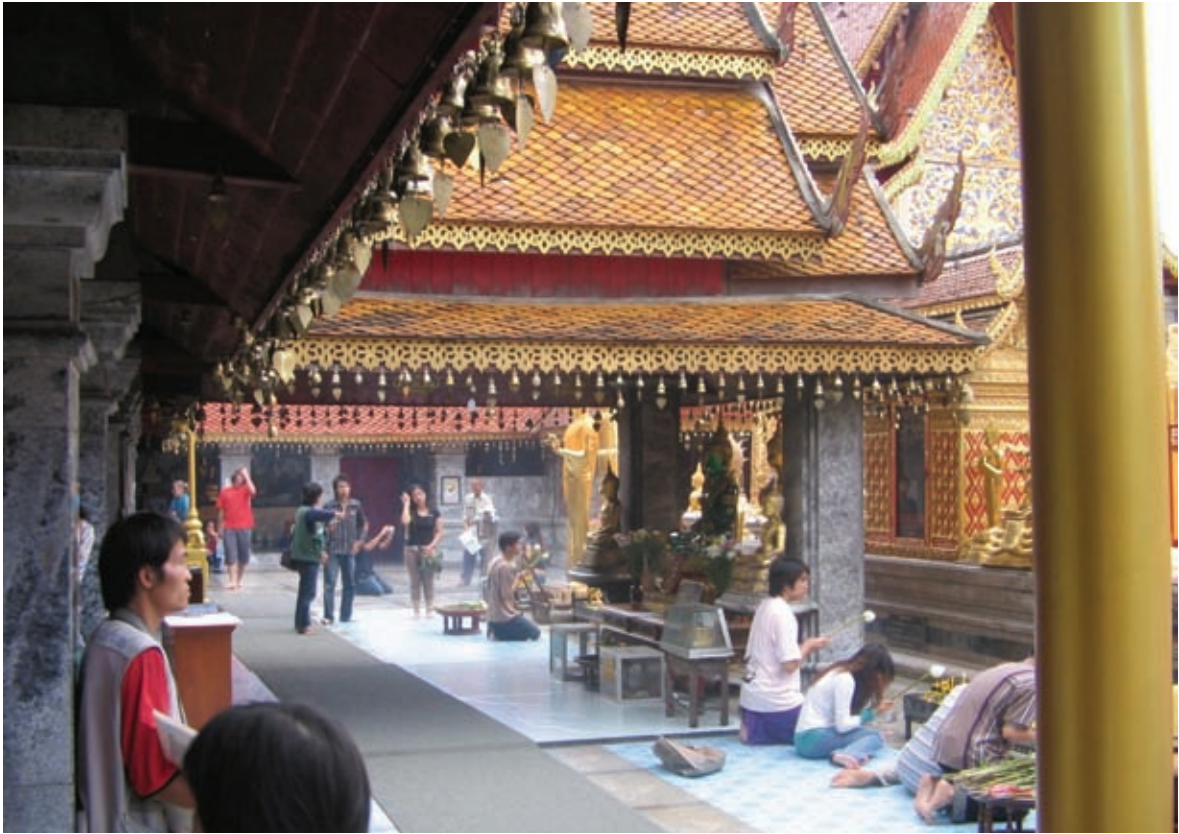
Arriba. Templo Wat Chedi Luang. Chiang Mai. Tailandia. Abajo. Paisaje Natural. Phuket. Tailandia.