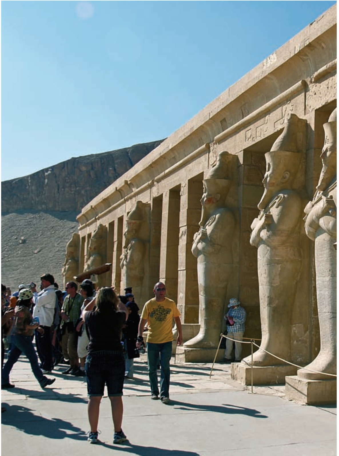
Arriba. Templo de Hatshepsut. Egipto.