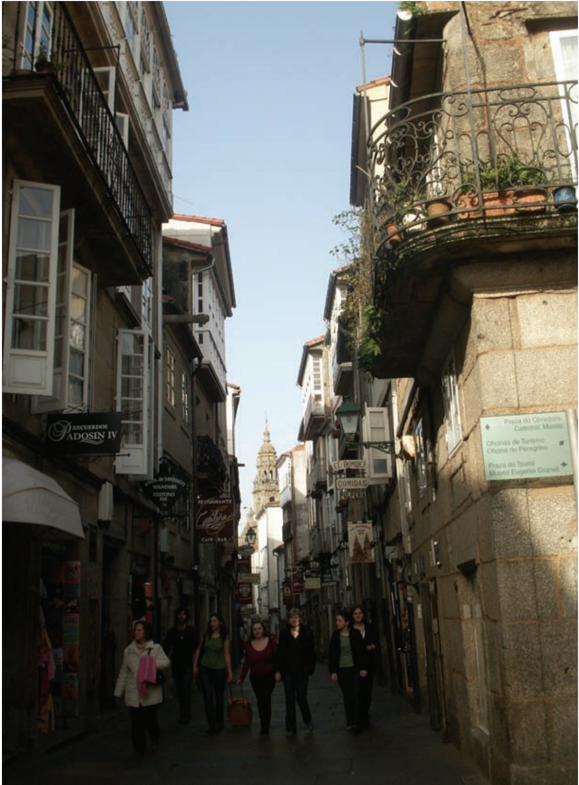
Arriba. Rúa do Franco de Santiago de Compostela, La Coruña. España.