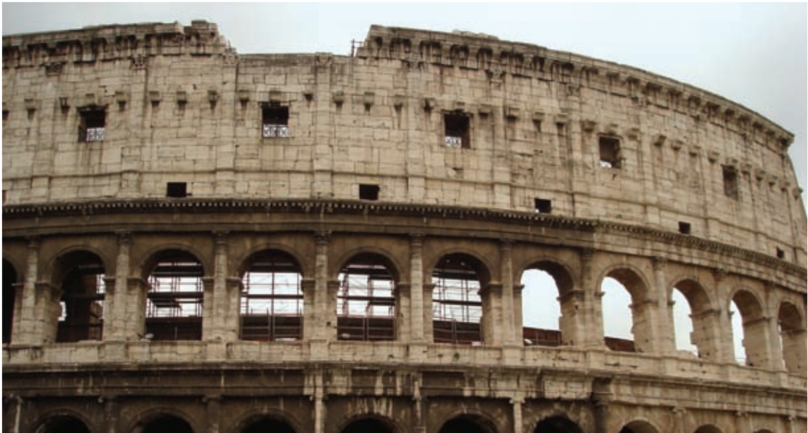
Arriba. Coliseo. Roma. Italia.

En los primeros años setenta se creó la Asociación Internacional para la Economía de la Cultura, que desde 1977 publica su revista Journal of Cultural Economics . En 1976, Mark Blaug edita una primera recopilación de artículos sobre el tema (que ampliará en 2001). Pero es ya en la última década cuando empieza a cobrar mayor fortaleza esta línea de investigación que abarca distintos campos con características diferenciadas: des-