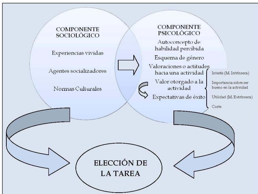
Figura 3. Cuadro resumen Modelo Elección de Logro. Elaboración propia

Este modelo está formado por dos componentes, el sociológico en el que forman parte factores como las experiencias pasadas, los comportamientos y actitudes de los principales agentes socializadores o las normas culturales van a condicionar tanto el valor asignado a una tarea como el pensamiento de competencia hacia dicha tarea. El otro componente será el psicológico, el cual se verá influido por el componente anterior y en el que se estudiarán factores como el autoconcepto de habilidad, la identidad de género, las valoraciones o actitudes que se tienen hacia ciertas actividades, las expectativas individuales de éxito y el valor que se le asigna a esa actividad.