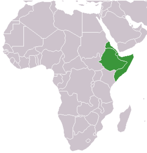
El Cuerno de África.

Se observa que esta región ha sido vigilada de cerca por las grandes potencias, sobre todo las occidentales. A lo largo de los años el objetivo fundamental tanto para los Estados Unidos, Francia, Reino Unido, Italia o Alemania ha sido dominar esta zona geoestratégica. Más recientemente países como Rusia, Japón o China también se han interesado en el territorio. China ha puesto su foco de atención en esta zona donde puede influir significativamente. Como ya hemos mencionado, la implementación de la estrategia de la Nueva Ruta de la Seda le permite, asimismo, acceder al resto de África con mayor facilidad.