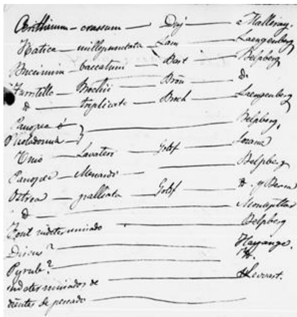
FIGURA 2. Inventario (borrador manuscrito) de las colecciones geológicas traídas de diversos lugares de Europa por Vilanova. Archivo MNCN.

Paralelamente, este naturalista se creará una reputada imagen como divulgador científico, sirviendo de puente científico entre España y el resto de Europa, lo que será clave para entender sus logros futuros y aportaciones. Actualmente, se encuentra en el Museo Nacional de Ciencias Naturales una completa colección de rocas, minerales y fósiles, obtenida durante las excursiones geológicas que Vilanova realizó a mediados del siglo XIX a diversos países europeos, y cuyo material paleontológico está siendo objeto de estudio.